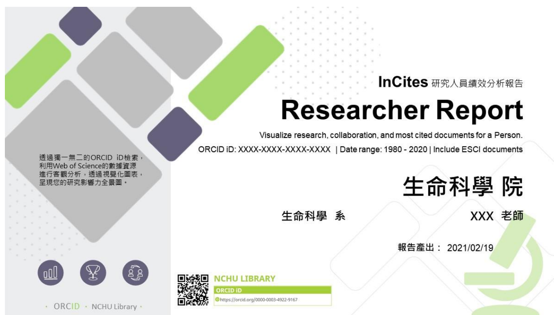
圖 3 ORCID 教師專屬服務之研究人員績效分析報告

圖書館再透過 InCites 使用 ORCID iD 檢索，從整體研究產出、生產力、表現力及合作情形四大面向進行客觀分析，透過學術指標和視覺化圖表，呈現教師個人研究影響力全景圖。