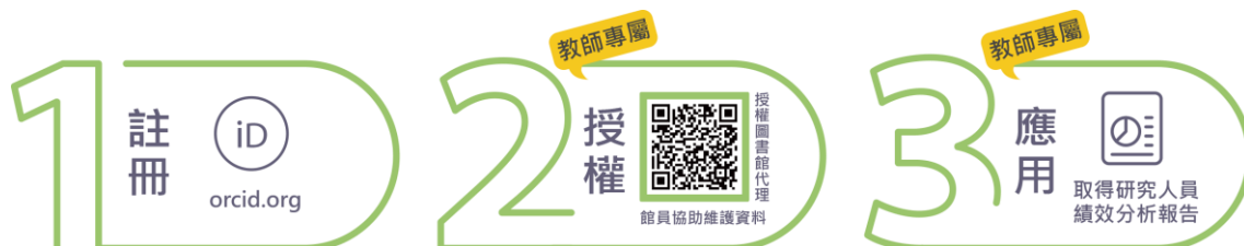
圖 1 ORCID 教師專屬服務

只要教師完成授權，接下來的事就交給圖書館吧！圖書館為確保每筆為教師本人著作，利用「科技部學術研發服務網」、系所及教師個人網頁蒐集著作清單，完整教師學術履歷；由於 Web of Science (簡稱 WOS)每月會自動與 ORCID 進行資料交換，待圖書館完成維護 ORCID 頁面後，教師被 WOS 收錄的著作將自動顯示 ORCID iD，這意味著教師不用再辛辛苦苦記下從以前到現在的投稿姓名，未來在 WOS 直接使用 ORCID iD 就能查詢到個人著作。